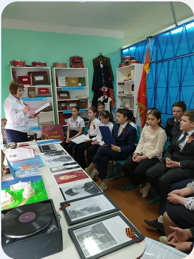
«Памяти наших прадедов» 6А класс