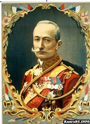
Алексей Алексеевич Брусилов - русский и советский военачальник и военный педагог, генерал от кавалерии

Тема: «Гражданская война и ее последствия. Культура Советской России в период гражданской войны».