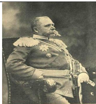
Генерал Павел Карлович Ренненкампф