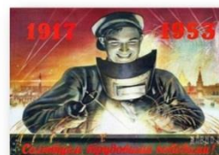
Трудовой героизм народа