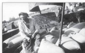
Продажа сельскохозяйственной продукции