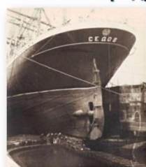
Репарации В СССР было ввезено более 5,5 тыс. «трофейных» промышленных предприятий