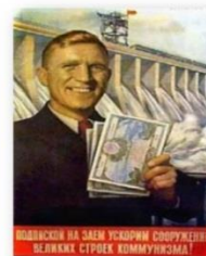
Займы у населения