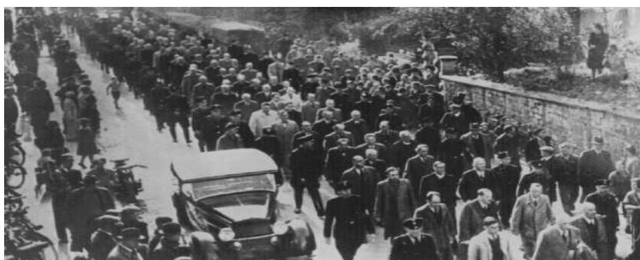
Арестованные евреи после «Хрустальной ночи»

Задание 8. Дискуссия на основе иллюстраций, показывающих последствия «Хрустальной ночи».