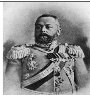
Генерал от кавалерии Александр Васильевич Самсонов