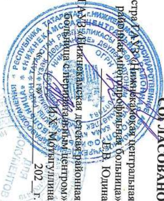
График прохождения учебной и производственной практики 3 курса Специальность Акушерское дело, Фармация, Лечебное дело, Сестринское дело (О-3) с 30.03.26 по 20.06.26 г.