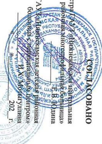
График прохождения учебной и производственной практики 2 курса Специальность Сестринское дело с 14.05.26 по 17.06.26 г.