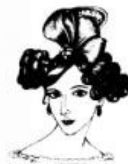
Европа XIX в.