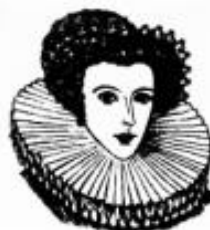
Европа XVII в.