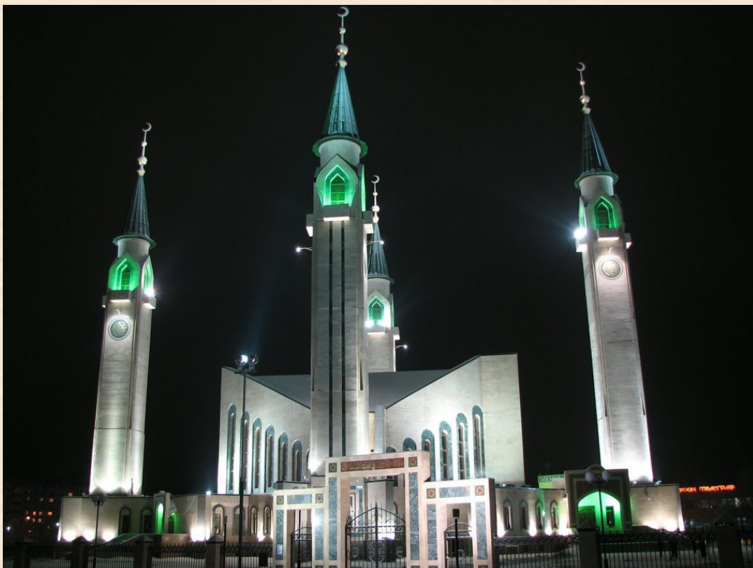
Мечеть города Нижнекамск

Дом народного творчества - это культурный центр нашего города. Здесь проходят гастролы театров, цирка, филармоний, эстрадных артистов. Все значительные события города отмечаются в залах Дома техники. медресе, библиотека, гостиница. Мечеть будет облицована мрамором.